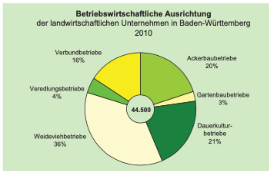
Abbildung 3: Betriebswirtschaftliche Ausrichtung der landwirtschaftlichen Unternehmen in Baden-Württemberg 2010. (Quelle: Statistisches Landesamt Baden-Württemberg 2020).

Die nachfolgende Abbildung 3 zeigt die Schwerpunkte der landwirtschaftlichen Betriebe in Baden-Württemberg auf.