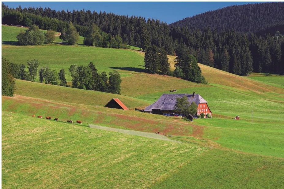
Abbildung 5: Typischer Bauernhof im Schwarzwald – in Einzellage umgeben von Dauergrünland und Wald (Quelle: triolog, Freiburg).