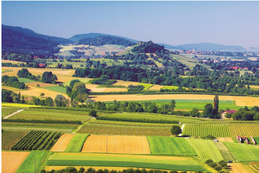
Abbildung 4: Blick in die Rheintalebene mit kleinparzellierten Ackerflächen

Bezüglich der Flächenausstattung der Betriebe (gemeint ist das Verhältnis von eigenen Flächen zu Pachtflächen) ist der Pachtflächenanteil an der Landwirtschaftlichen Fläche insgesamt seit den 1970er Jahren in Baden-Württemberg stark gestiegen und hat sich auf 60 % fast verdoppelt (Statistisches Landesamt Baden-Württemberg 2020).