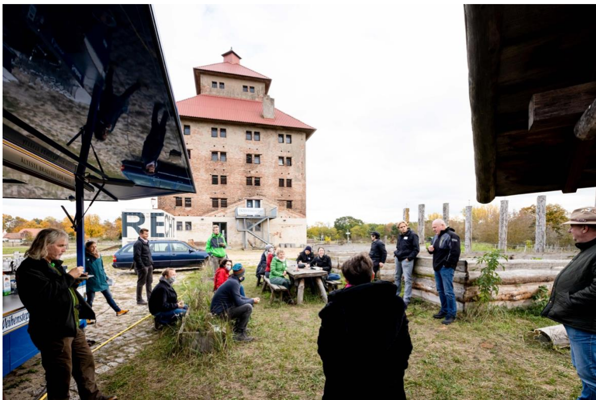
Abbildung 2: Beim Mittagsimbiss lauscht die Gruppe dem Input von .... am Gut Hobrechtsfelde

1) Wie lassen sich Tourismus, Agrarproduktion und Naturschutz auf den Flächen zusammen-bringen? Wie trägt sich das Modell wirtschaftlich?