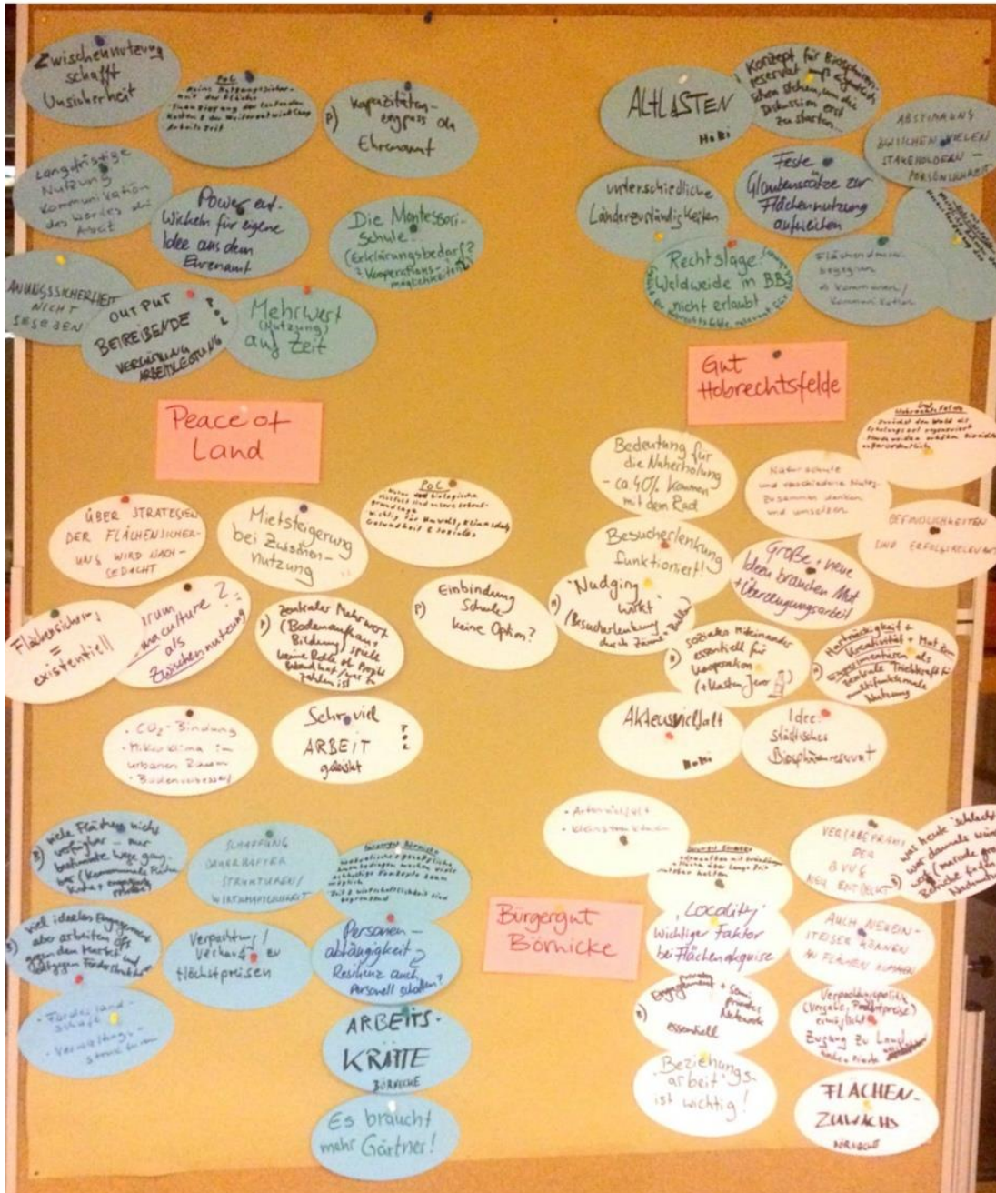
Abbildung 4 Übersicht zur Auswertung der drei Stationen auf der Studienfahrt (weiße Kärtchen: wichtige Erkenntnisse, blaue Kärtchen: Herausforderungen)

Daraufhin wurden zunächst wichtige Erkenntnisse und Herausforderung von den am Vortag besuchten Stationen gesammelt.